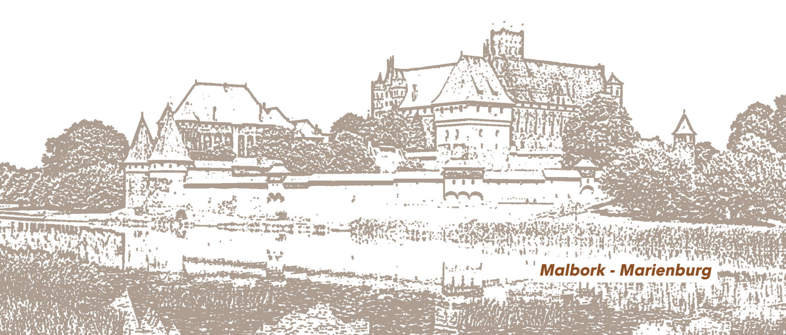
Malbork - Marienburg